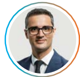
Cosmin Poteraș Senator, Dolj