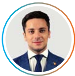
Filip Havărneanu Deputat, Iași