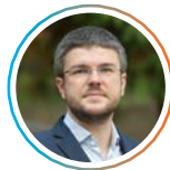
Irineu Darău Senator, Brașov