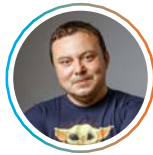
Cătălin Teniță Deputat, București