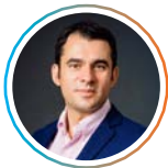
Ștefan Pălărie Senator, București

Nouă, inițiatori ai proiectului, ni s-au alăturat alți 9 parlamentari , membri ai Comisiilor de Învățământ din Senat și Camera Deputaților sau susținători activi ai educației din România.